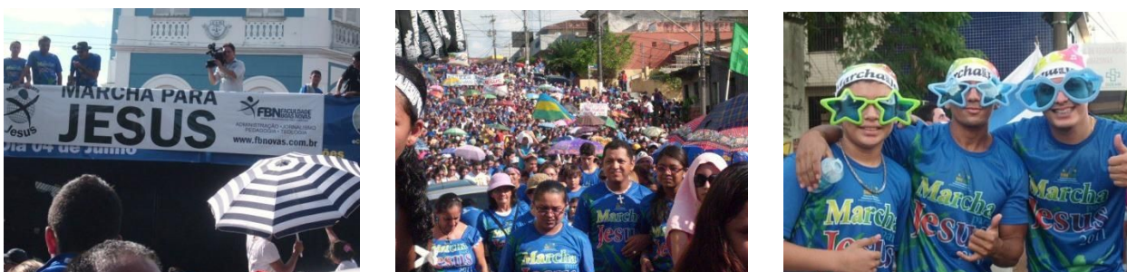
Faculdade Boas Novas participa com Trio Elétrico da Marcha para Jesus 2011. O evento ocorreu dia 4 de junho. Saiu da Praça da Bíblia rumo ao Sambódromo.