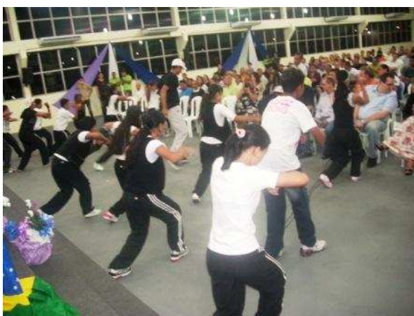
Como sempre, com casa lotada. O projeto de Extensão É tempo de adorar fez participação Especial.